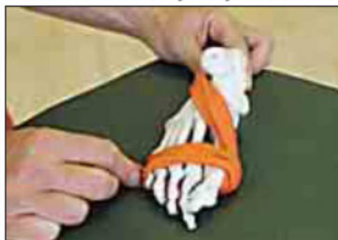
Stabilität des Fußes: Ohne „Bodenbrücke“ sind Schmerzen und Abnutzung der Füße die Folge.